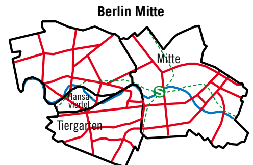
Stand: Januar 2010 · Änderungen vorbehalten.